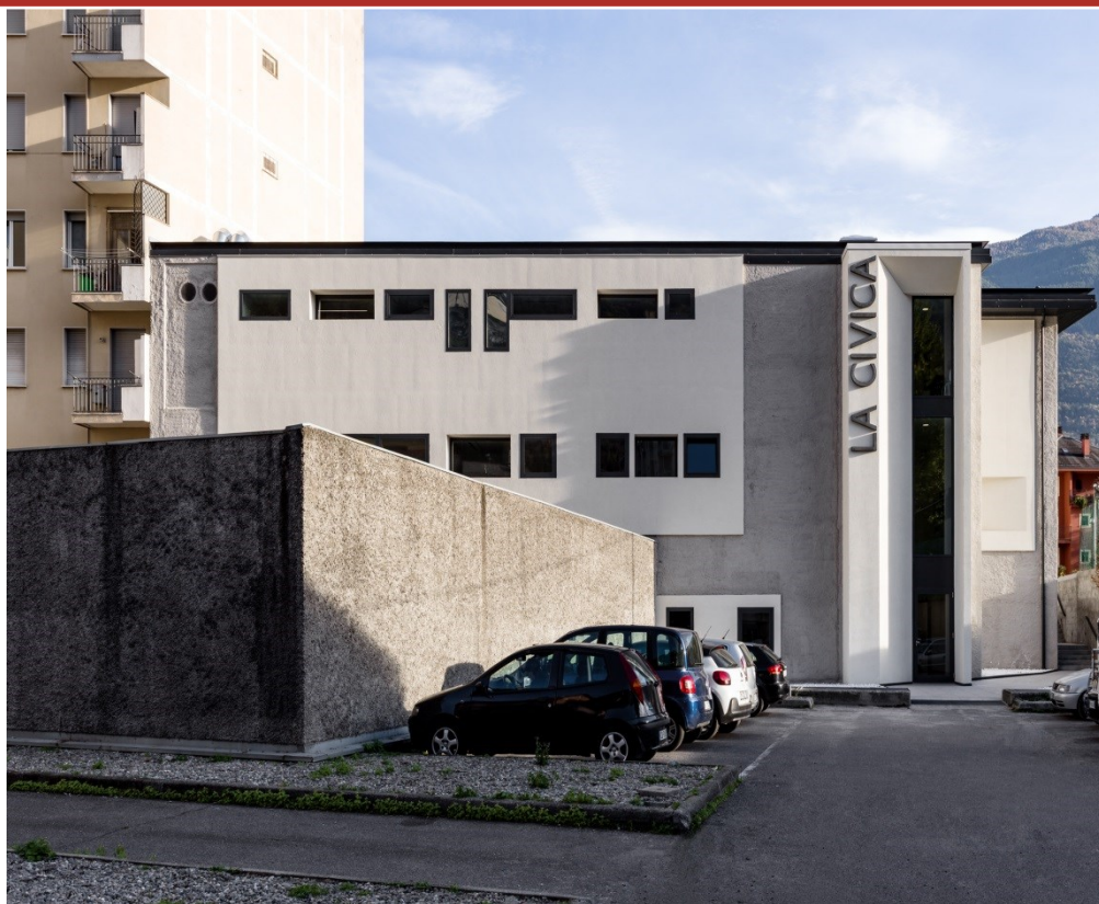
"Casa della Musica" di via Lungo Mallero Diaz – facciata ovest – inaugurata il 20 ottobre 2018